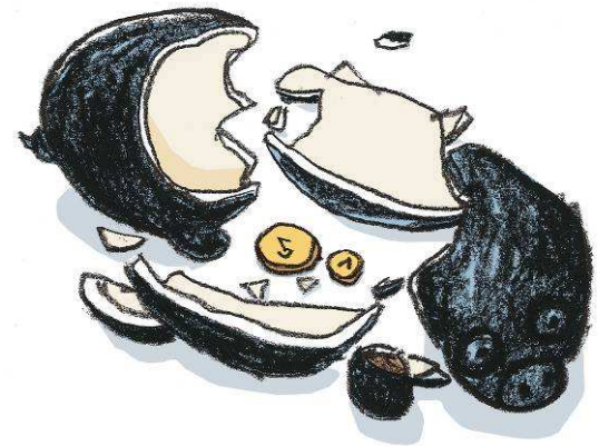
« Les porcs étaient en quelque sorte la tirelire des familles » - illustration d'Etienne Gendrin -

Un journal cairote, a diffusé un article sur le mécontentement de la population de certains quartiers du Caire. Les habitants commencent à se plaindre des déchets qui restent dans les rues. Bien sûr, les Chiffonniers collectent en priorité les matières qui sont recyclables et ramassent le moins possible de déchets organiques qu'ils devront ensuite porter à leurs frais, dans une décharge dans le désert (80 livres égyptiennes par voyage).